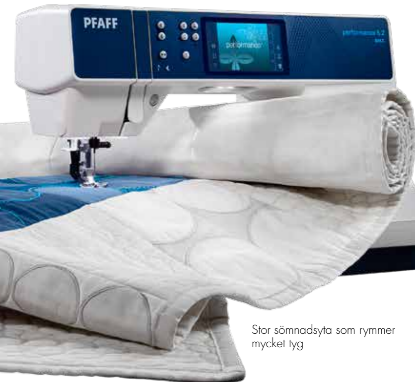
Stor sömnadsyta som rymmer mycket tyg

Allt detta och mycket mer väntar på dig.